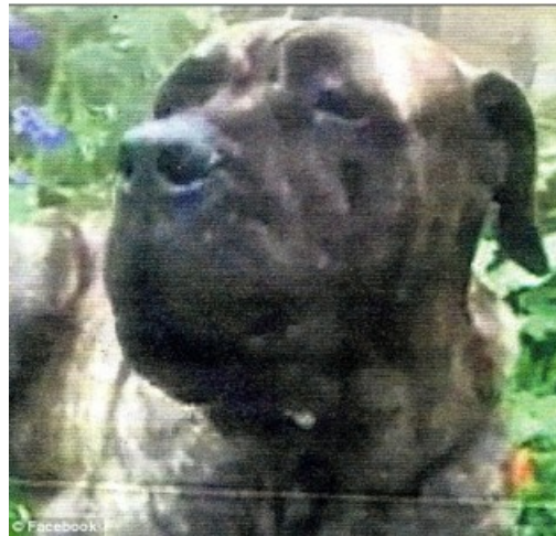
Hond nr. 15