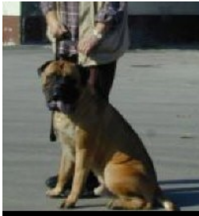
Hond nr. 1