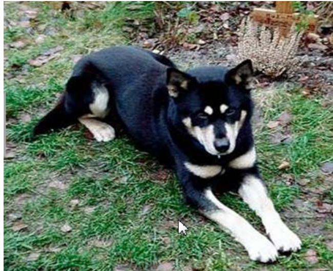
Hond nr. 4