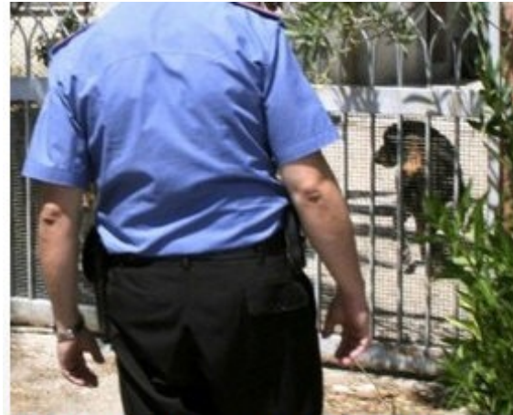
In un'immagine del 6 agosto scorso, un carabiniere osserva il cane di razza Rottweiler che quel giorno aggredì il bambino